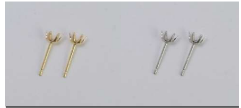
片側0.2ct φ0.7 × 10ミリ芯