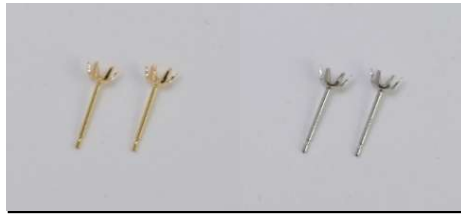
片側0.15ct φ0.7 × 10ミリ芯