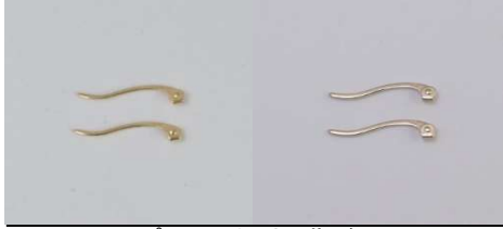
プレス可倒式 曲がり