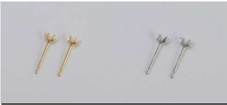
片側0.1ct φ0.7 × 10ミリ芯