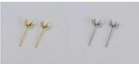
片側0.3ct φ0.7 × 10ミリ芯