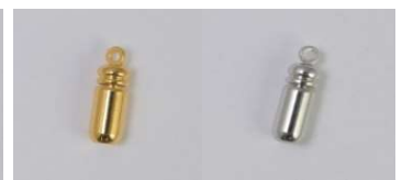
真鍮製 キヤッチ カン付