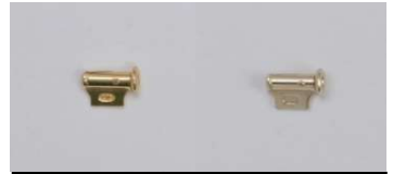
テッポウ(S)切り口上