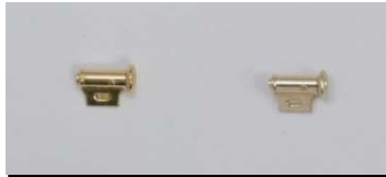
テッポウ(S)切り口横