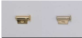
テッポウ(M)切り口横