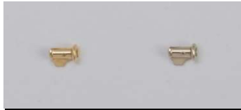
テッポウ(SS)切り口上