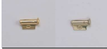
テッポウ(M)切り口上