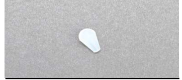
セーフティーシリコン